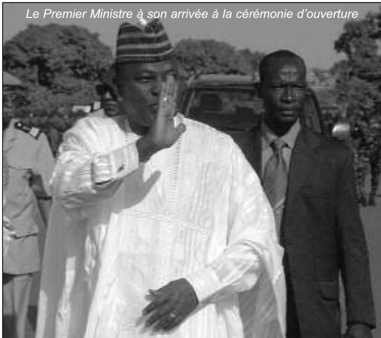
Le Premier Ministre à son arrivée à la cérémonie d'ouverture

sur le fait que la culture est un trait d'union entre les peuples. Le président du CNO pense ainsi que le thème de cette édition ouvre les frontières culturelles du Burkina Faso à toutes les cultures du monde. Il a ensuite terminé son intervention en précisant que le programme de cette 13e édition de la SNC a été conçu afin que chacun y trouve son compte.