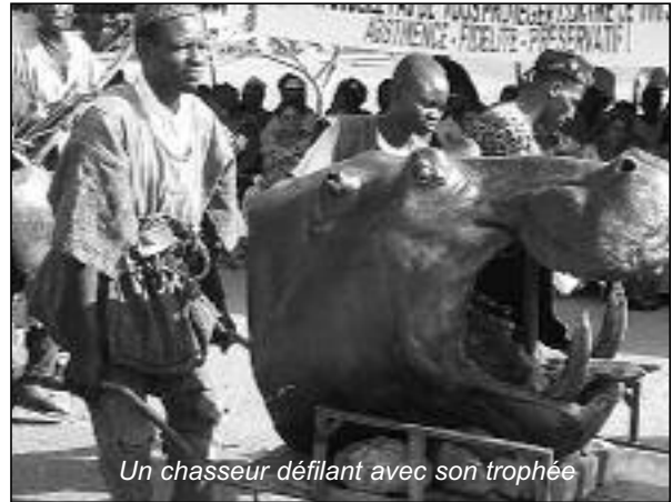
Un chasseur défilant avec son trophée

nale de la culture qui est, faut-il le rappeler, « Culture et intégration des peuples ». Selon lui, l'intégration est « une réalité construite et vécue au quotidien depuis toujours dans la cité de Bobo-Dioulasso ».