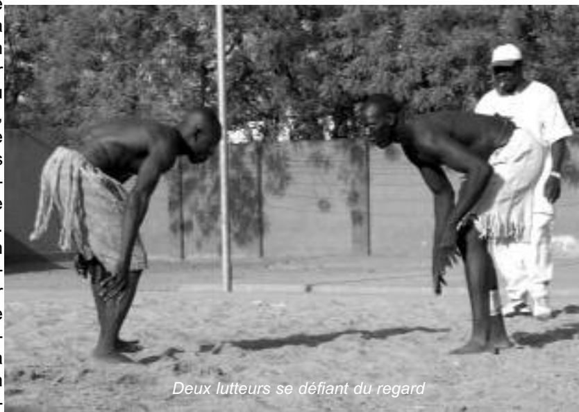
Deux lutteurs se défiant du regard