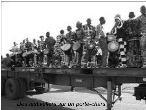
Des festivaliers sur un porte-chars

Le bal des allocutions s'est poursuivi avec l'intervention du parrain de Bobo'2006, Bougnounou Ouétian. Une interventions débordant de sagesse et