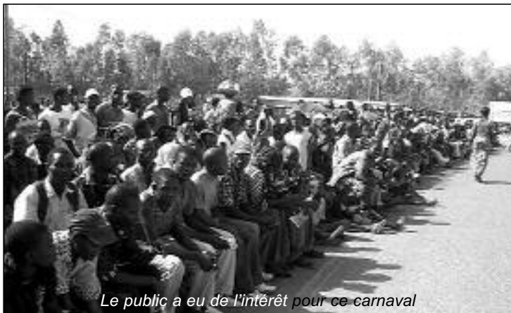
Le public a eu de l'intérêt pour ce carnaval

nale de la culture qui est, faut-il le rappeler, « Culture et intégration des peuples ». Selon lui, l'intégration est « une réalité construite et vécue au quotidien depuis toujours dans la cité de Bobo-Dioulasso ».